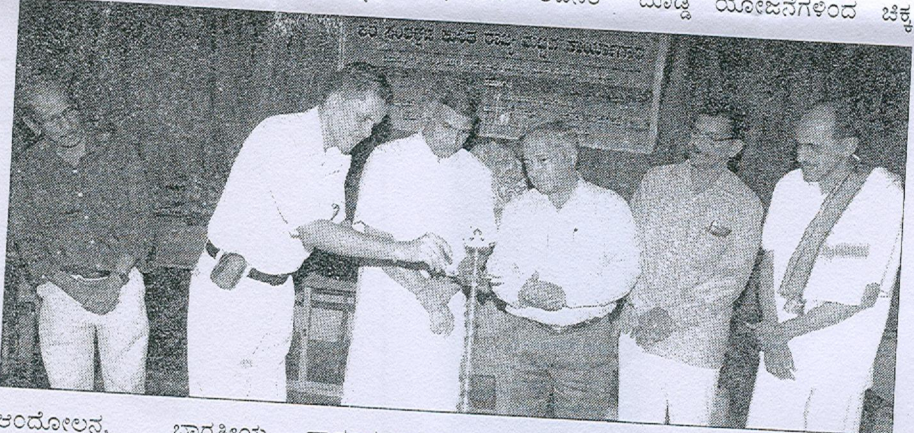
ಅಂದೋಲನ, ಭಾರತೀಯ ಪ್ರಾರಂಭವಾಯಿತು. ದೇಶದಲ್ಲಿ ಯೋಜನೆಗಳು ಕುಂಠಿತಗೊಂಡಿವೆ.